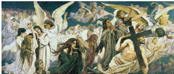
Благоразумният разбойник в предвзретието на Рая, част от стенописнатата композиция „Радостта на праведните в Господа“, от подкуполното пространство на катедралата „Св. Владимир“ в Киев, Украйна. Художник Виктор Васнецов (1848-1926).

В старозаветни времена между вярващите в истинния Бог и езичниците е съществувала непреодолима преграда между „избраните“ и останалите – „псетата“, както алегорично се изразява Христос пред самарянката. Той обаче почти винаги се е срещал с тъкмо такива странни хора – болни, бесновати, прокажени (в онези времена болестта и страданието са били признак на грях и на Божие наказание), митарии, блудници, грешници, не се е гнушал от тях, общувал е свободно с такива хора, макар и да е съветвал Своите апостоли да отиват при „загубените овци от дома Израилев“ (Мат. 10:6). Хора като самарянката и като хананейката не са почитали истинския невидим Бог на Моисей, Който е открил Своите заповеди, но Христос е общувал с тях, а фарисеите са Го упреждали за това.